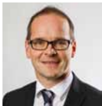
Grant Hendrik Tonne Niedersächsischer Kultusminister

Auf dieser Grundlage werden Sie eine fundierte Entscheidung für den weiteren Bildungsweg Ihres Kindes treffen können. Ein glückliches Kind, das den Anforderungen der gewählten Schulform motiviert begegnet, sollte das gemeinsame Ziel sein.